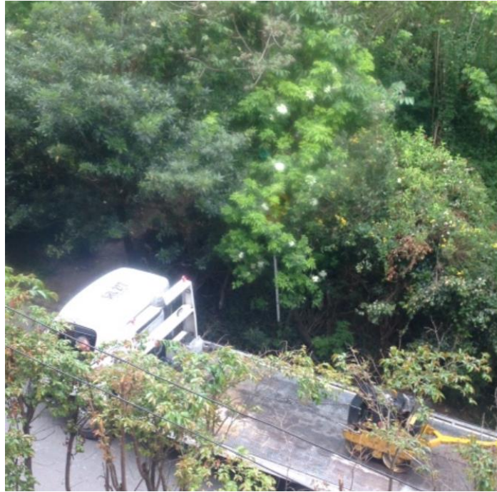
Fotografía No 3: Paso de maquinaria pesada por el sector.

ALCALDÍA MAYOR DE BOGOTÁ D.C. SECRETARÍA DE AMBIENTE