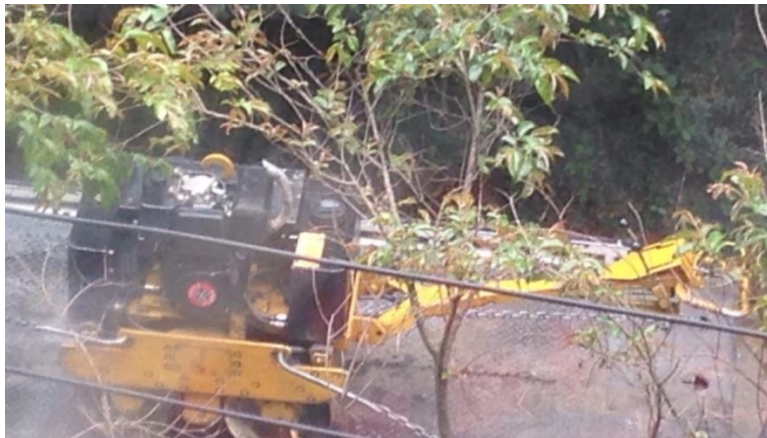
Fotografía No 4: Paso de maquinaria pesada por el sector, la cual posteriormente fue escuchada en funcionamiento en las obras.

Secretaría Distrital de Ambiente Av. Caracas N° 54-38 PBX: 3778899 / Fax: 3778930 www.ambientebogota.gov.co Bogotá, D.C. Colombia