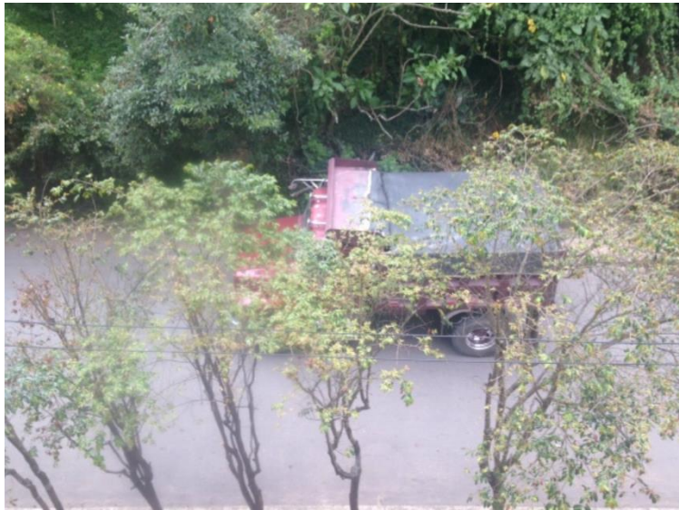
Fotografía No 1: Volqueta con material cruzando por el sector

En virtud de lo anterior anexamos a la presente el registro fotográfico y los videos que ha sido enviados a esta autoridad ambiental.